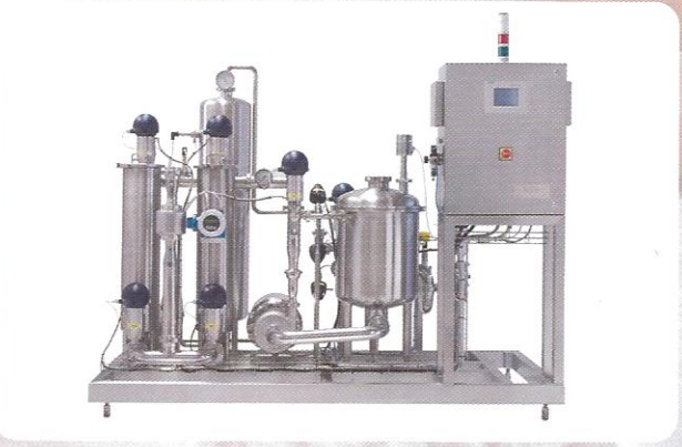
FULL OTOMASYONLU SÜT ALIM ÜNİTELERİ