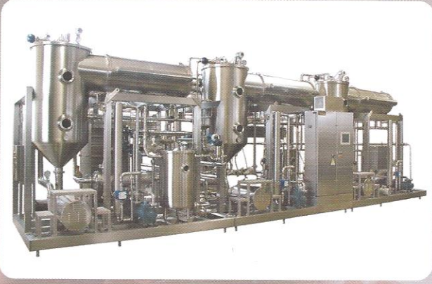
PEYNİR ALTI SUYU EVAPORATÖRLERİ