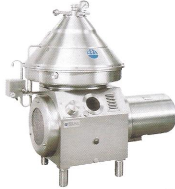
KLARİFİKATÖRLER (Temizleyiciler) - BAKTOFÜJLER (Bakteri Ayırıcılar)