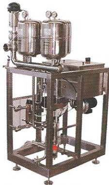
PROTEİN GERİ KAZANIM ÜNİTELERİ