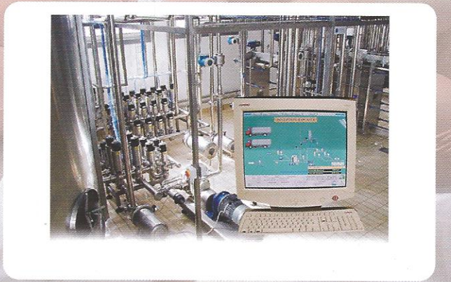
PROJE - MÜHENDİSLİK - OTOMASYON