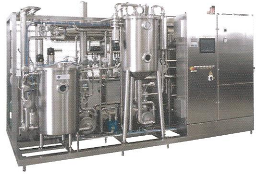
KOMPLE PASTÖRİZASYON ÜNİTELERİ (Borulu - Plakalı)