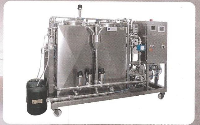
FULL OTOMASYONLU CIP SİSTEMLERİ