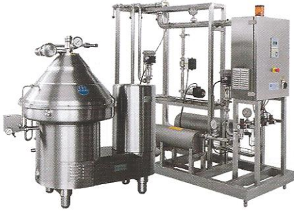
KREMA SEPARATÖRLERİ & KREMA STANDARDİZÖRLERİ