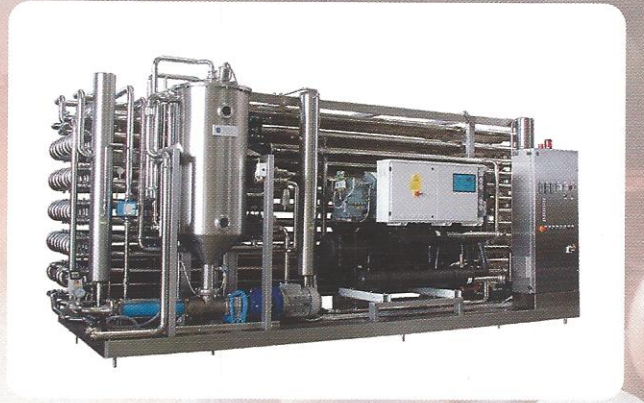
EVAPORATÖRLER - KONSANTRATÖRLER (Düşük Sıcaklıkta)