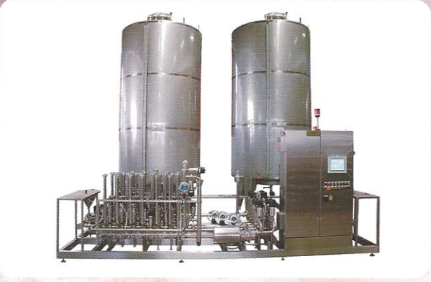
MEYVE SUYU HAZIRLAMA ÜNİTELERİ (Full Otomasyonlu)