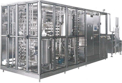
KOMPLE UHT ÜNİTELERİ (Ultra High Temperature)